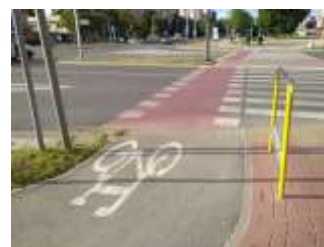
Kielce – cyklistická infraštruktúra, str.13