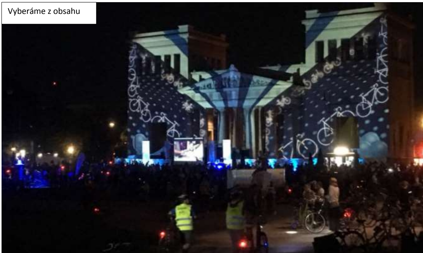
Cyklonoc v Mníchove prilákala 16 tisíc cyklistov, str.9