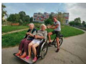
V Bratislave vozia seniorov na bicykli, str. 4