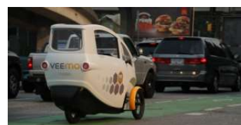
Velometro bikecarsharing z Kanady, str.6