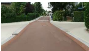
Holanďanský príklad spolupráce pri budovaní cyklocestičky, str.11