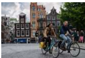
Holanďanom budú platiť za chodenie do práce na bicykli, str.5