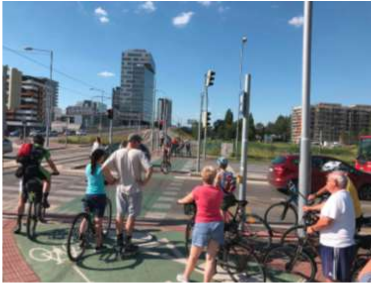
Holandsko? Nie, cykloradiála R18 v Petržalke práve teraz..