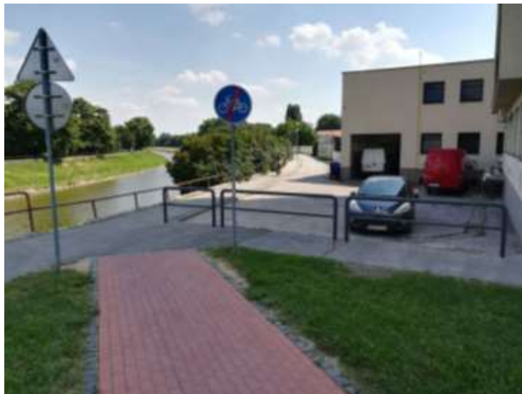
Zábradlie , o ktoré sa môže oprieť ne jeden cyklista v Nitre.....:-(