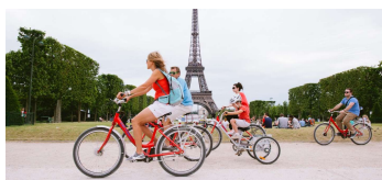
Paríž zistil, že podporou bicyklov znížil počet automobilov v meste, str.7